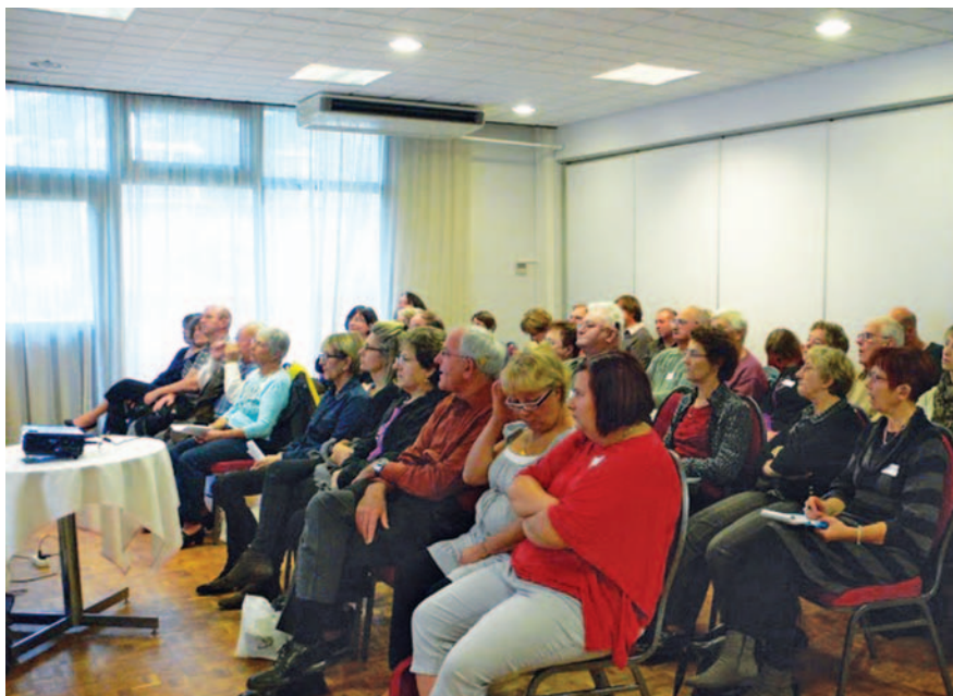
Le 5 novembre 2011 a eu lieu la deuxième réunion du Cisic en région Lorraine à Nancy.