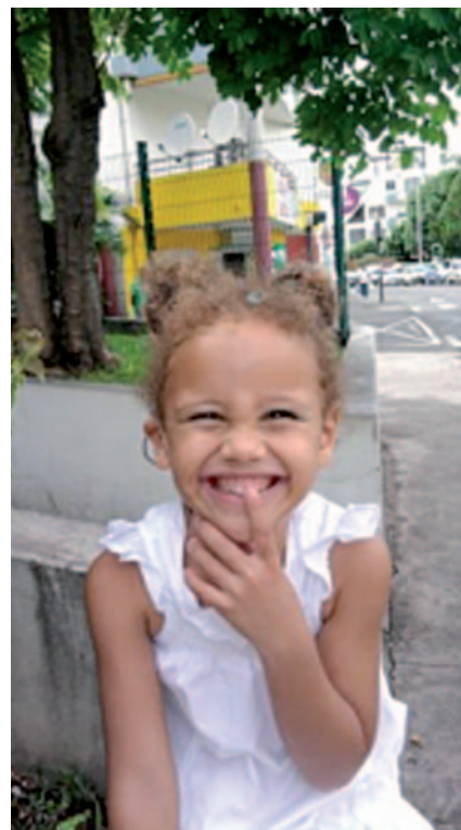
Maxima, implantée en Janvier 2010 à Montpellier, réside sur l'île de La Réunion.