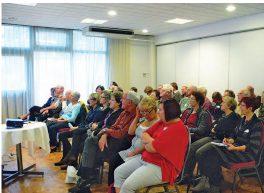
Le 5 novembre 2011 a eu lieu la deuxième réunion du Cisic en région Lorraine à Nancy.