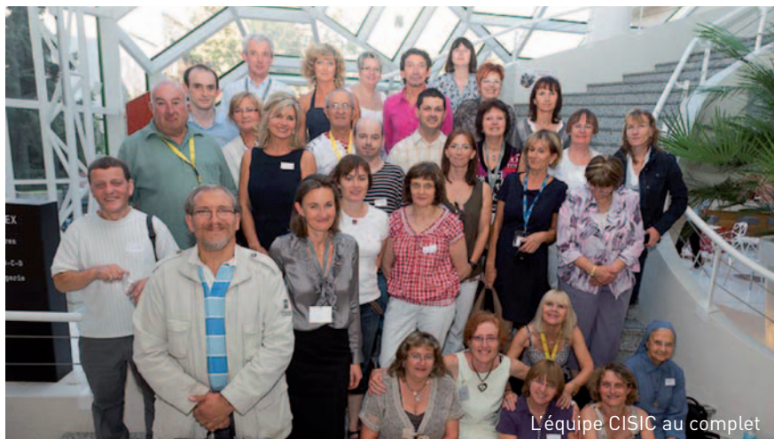
L'équipe CISIC au complet

- mises en place de nouvelles antennes régionales en collaboration avec les CHU de Clermont-Ferrand, Dijon, Lille, Limoges, Rouen, Saint-Etienne, Strasbourg et Tours. Une antenne est également mise en place à l'Île de La Réunion, - accord pour la diffusion de notre livret « L'ambition d'entendre » au travers des principaux centres d'implantation.