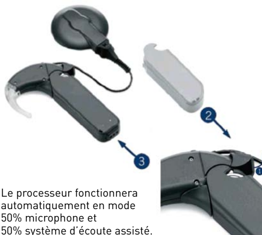
Configuration « Baby »

Le processeur fonctionnera automatiquement en mode 50% microphone et 50% système d'écoute assisté.