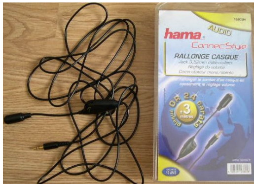
rallonge de casque avec sa molette

Inutile de dépenser une somme exorbitante. Celui-ci vaut environ 35 euros.